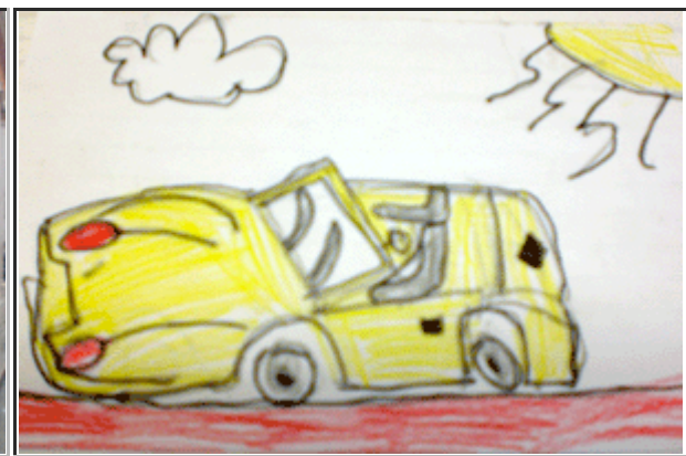
Il Gran Premio Terre di Canossa è un raduno di auto storiche di portata internazionale